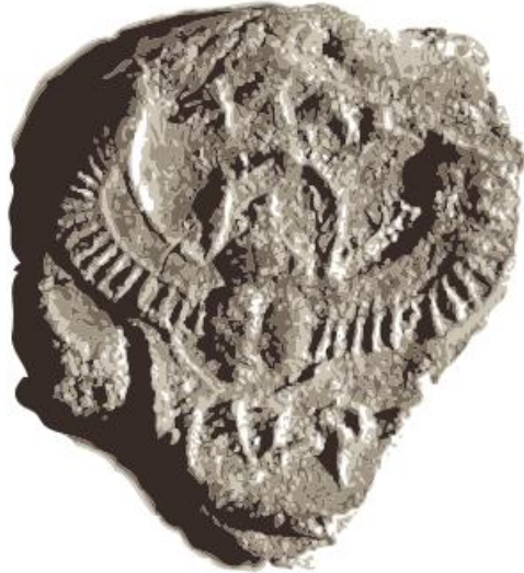
Figura 4. Fragmento de bula. Se lee: “(perteneiente a) Ezequías (hijo de) Acaz, rey de Judá.” 1

En la literatura del Antiguo Testamento como en la neotestamentaria, se puede notar que el empleo del sello corresponde tanto a usos literales, figurativos, como apocalípticos. 2 A continuación se presentará un análisis de los principales términos hebreos empleados en el A.T. y su posterior uso en el Nuevo.