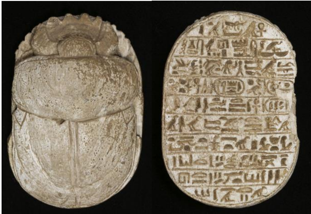
Figura 2. Sello Escarabajo conmemorativo de Amenhotep III. 2

La historia del sello en Egipto va ligada con su sucesión dinástica. Aunque durante las primeras dinastías el sello cilíndrico mesopotámico era frecuentado, durante la dinastía seis un nuevo instrumento haría su aparición: el escarabajo 1 .