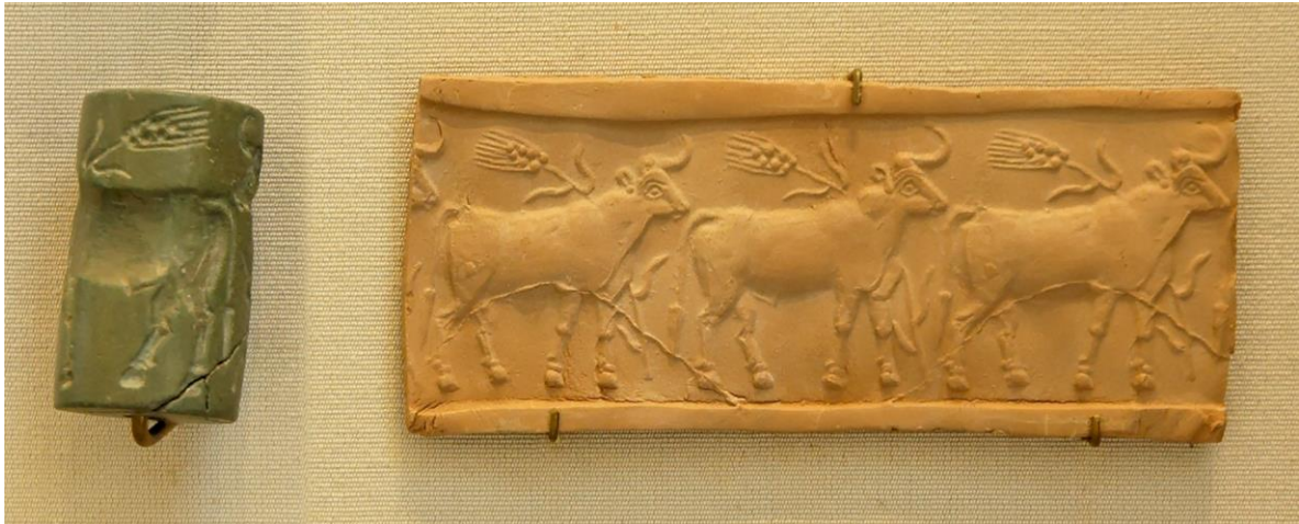
Figura 1. Sello cilíndrico e impresión. Grupo de ganado en un campo de trigo. Caliza, Mesopotamia, período de Uruk 1 .

Los sellos cilíndricos consistían en un cilindro grabado que tras rodarse en una superficie blanda como la arcilla, dejaba una marca a manera de firma. Los materiales usados para producirlos iban desde piedras duras, preciosas o semipreciosas (lapislázuli, cornalina, esteatita, andesita), hueso o marfil, hasta en algunos casos madera. 2