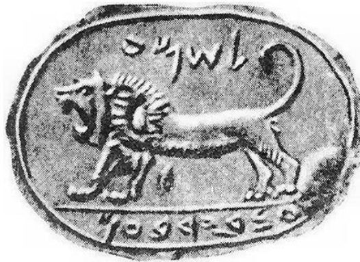
Figura 3. Sello hallado en Meguido del reinado de Jeroboam II. Es datado entre el (787 – 747 a.C.). Sobre el león rampante está escrito shema : “Dios nos ha oído”, y debajo: “servidor de Jeroboam”. 3

A diferencia de Mesopotamia, los sellos mayormente empleados en Israel eran aquellos que se estampaban. Por tanto, a menudo se ha encontrado que los sellos israelitas tenían “grabado el nombre del dueño acompañado ya sea de su función o el nombre de su padre”. 2