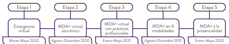
Figura 1: Proceso de adecuación del MDA+

El MDA+ fue adecuándose según las exigencias gubernamentales y las necesidades de la UM en los distintos momentos del desarrollo de la pandemia, para una mayor atención a los estudiantes y sus familias. Desde sus inicios hasta la fecha, este proceso ha pasado por cinco etapas (ver figura 1).