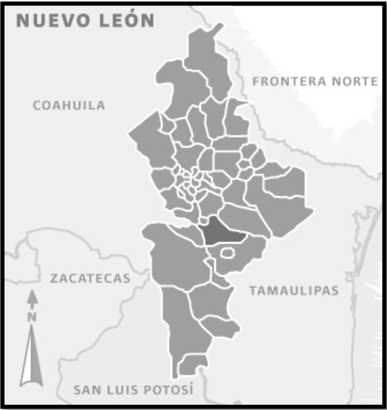
Figura 1: Mpio. Montemorelos, NL.