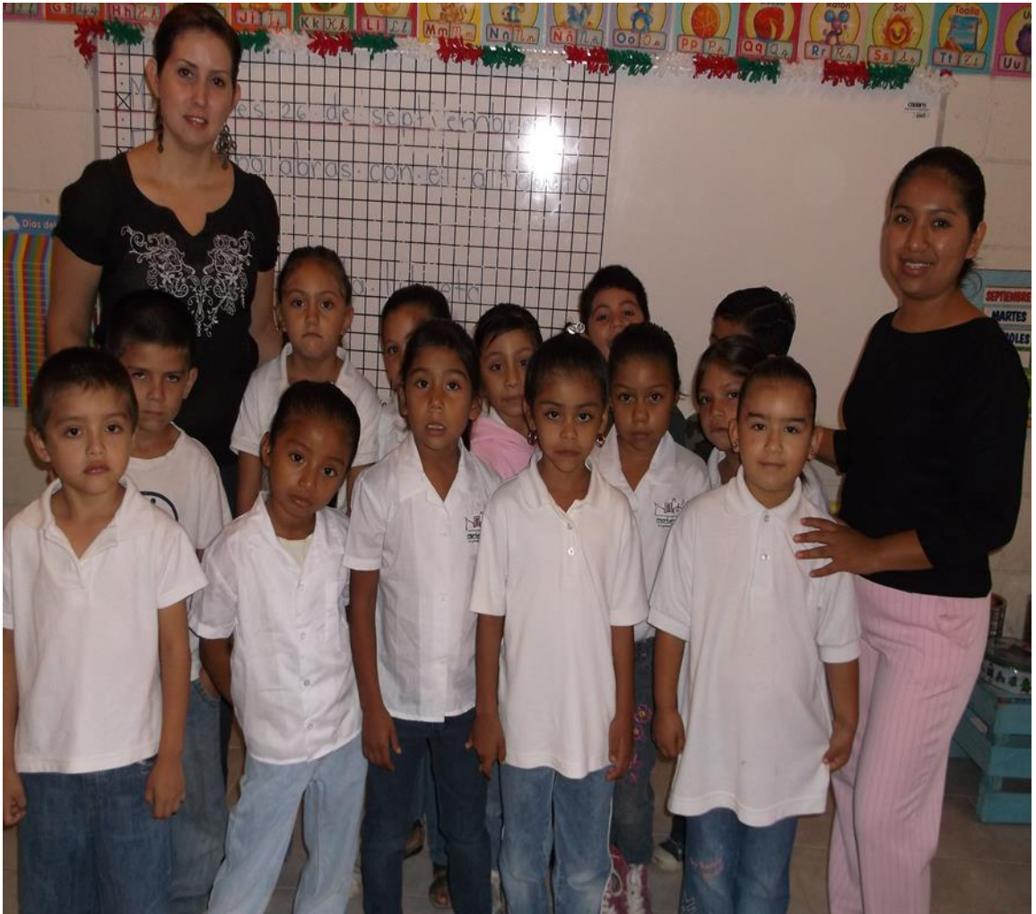
Fotografía grupal 1° "A" Escuela Primaria "Lic. Adolfo López Mateos"