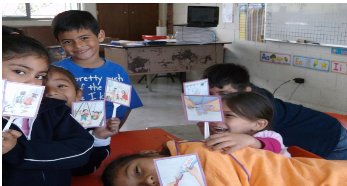
Los niños trabajando en equipo para armar la historia.