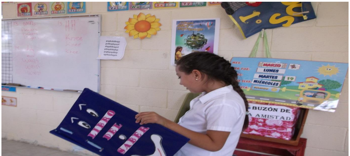
Libro del saber