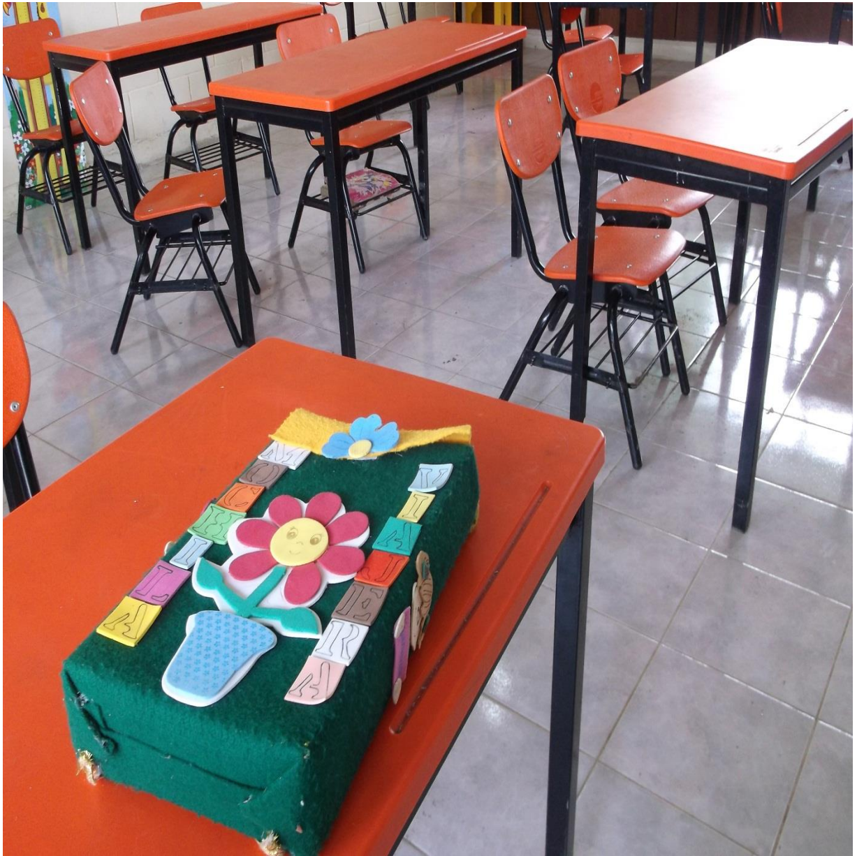
Mochila hecha para la lectura en casa.